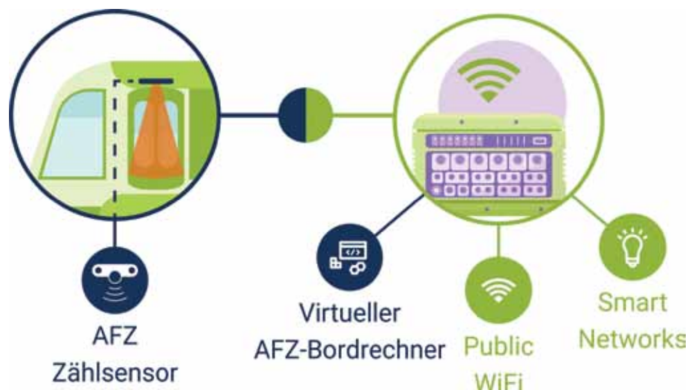
Bild 2. Virtualisierte AFZ-Bordrechner Applikation auf WLAN-Router.

Die Kombination eines zentralen Fahrzeugrouters von Unwired Networks mit der Automatischen Fahrgastzählung von Interautomation (vgl. Bild 2) bietet einen perfekten Einstieg in moderne, zentralisierte Netzwerkorchestrierung. Mit einer vorausschauenden Auswahl der Router kann das System später einfach und kosteneffizient um weitere Anwendungen erweitert werden, um den maximalen Nutzen aus der zentralisierten Netzwerkarchitektur zu ziehen.